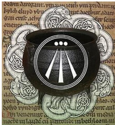
Het Awen symbool

Het gedicht over Cernunnos hierboven is het eindresultaat van een aantal meditaties over deze godheid, maar gedichten kunnen ook het startpunt van meditaties zijn. Zo kun je een gedicht een of een paar keer lezen en dan gaan mediteren. Door in je meditatie alert te zijn op je gevoelens, gedachten en andere sensaties kun je ervaren welke invloed het gedicht op je heeft, welke associaties en emoties het bij je oproept en welke, al dan niet verborgen, betekenissen het gedicht voor je heeft. Wat is de balans tussen torc en slang? Hoe voelt die aan? Hoe bereik en bewaar je die? Wordt er je een weg getoond door de heilige bossen van Andersland? Welke weg? Een gedicht kan het startpunt van een pathworking of creatieve visualisatie zijn.