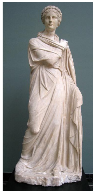
Polyhymnia, muse van o.m. religieuze poëzie

In dit gebed heb ik goed op het metrum gelet voor het ritme en heb ik meerdere vormen van rijm gebruikt. Deze technieken die van een normale, proza tekst poëzie maken zal ik hieronder toelichten.