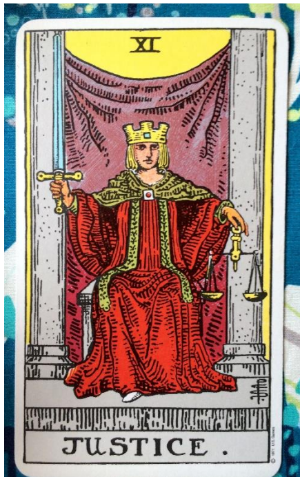
Justice, Rider Waite tarot