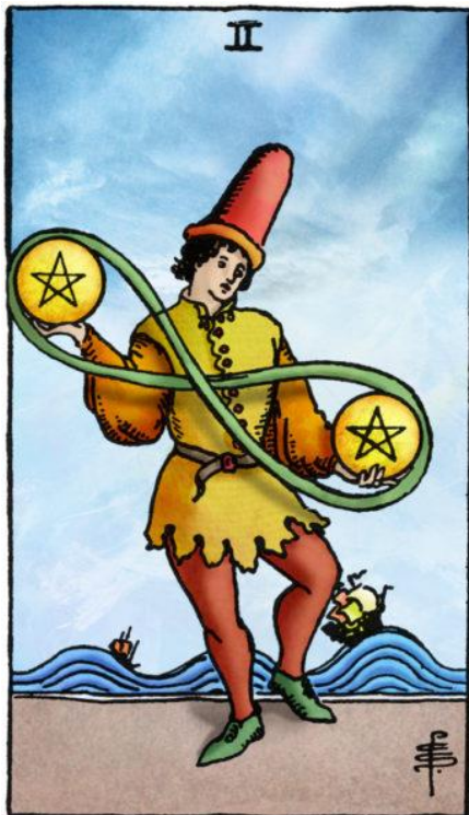
Schijven Twee, Rider Waite tarot

De eerste vraag die je nu moet stellen is uiteraard of je nog wel op zeilreis wilt gaan nu dat in je eentje moet, ook een 'Ware Wil' kan veranderen. Maar als dat zo is dan denk ik dat de Wiccan Rede je aanraadt om toch te gaan; "doe wat je wilt" staat immers voor "mits het niets schaad". Uiteraard schaad je hierbij je geliefde maar bij niet gaan schaad je jezelf. Verder is de meeste schade aan je geliefde niet door jouw veroorzaakt maar door de natuur. Dat is weliswaar heel naar; maar ook iets waar niemand iets aan kan doen, ook jij niet, en dus kun je je afvragen of je je verplicht moet voelen om deze door de natuur veroorzaakte schade te verlichten ten koste van schade aan jezelf. Of je wens om je 'Ware Wil' te volgen egoïstischer is dan de eventuele wens van je geliefde dat je dat niet doet. En uiteraard zijn ook hier weer veel verschillende versies mogelijk zoals definitief op zeilreis rond de wereld periodiek, een langere tijd op zeilreis en daarna bij je geliefde blijven, bij je geliefde blijven en periodiek een kortere zeilreis maken of een grote zeilboot kopen, die bemannen met een matroos en een verpleegster en je geliefde ondanks alles meenemen op zeilreis.