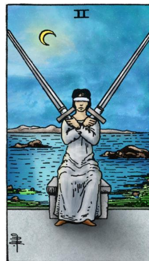
zwaarden twee, Rider Waite tarot

Het naleven van deze oude raad zal in de praktijk dan ook meestal neerkomen op "doe wat je wilt mits het zo weinig mogelijk schaad". De schrijver-in-spe van dit voorbeeld zal dus moeten inschatten met welke van de twee opties hij zichzelf de minste schade berokkend en die vervolgens kiezen en doen. Dat is lastig want vaak is het vooraf helemaal niet zo goed in te schatten hoeveel schade je oploopt bij het maken van een bepaalde keuze, bij het doen 'wat je wilt', of juist bij het niet maken van een keuze of het doen wat eigenlijk niet je wilt. Toch raadt de Wiccan Rede ons aan om in ieder geval te doen wat we willen en hierbij in ieder geval de schade naar beste vermogen proberen te beperken door het gebruik van ons gezonde verstand.