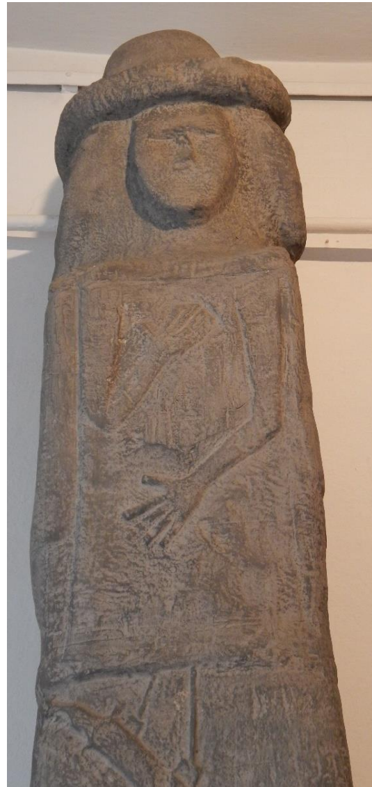
Slavisch godenbeeld, Lychkivtsi, Oekraïne

Ondergetekende is een van deze mensen. De cultuur van de streek waar ik ben opgegroeid (Zuid-Limburg) en de stad waar ik nu woon (Nijmegen) is gevormd door zowel Kelten als Germanen en Romeinen, daarna door Saksen en Franken en nog later door het Duitse, Spaanse en Franse rijk en bezocht door legers met huurlingen uit bijna elke Europese uithoek en cultuur.