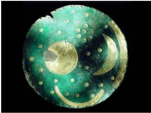
hemelschijf van Nebra

De Geest van de Tijd is noodzakelijk omdat we niet meer in het neolithicum, de bronstijd of ijzertijd leven maar in 'the plastic age of internet'. Hoezeer we ons ook op onze Keltische of Germaanse voorouders baseren, we zullen sommige van hun denkbeelden en gebruiken moeten aanpassen aan de behoeftes, mogelijkheden en smaak van deze tijd. Dat is niet iets nieuws, onze voorouders paste hun spiritualiteit ook aan nieuwe inzichten, ontwikkelingen, mogelijkheden en modes aan.