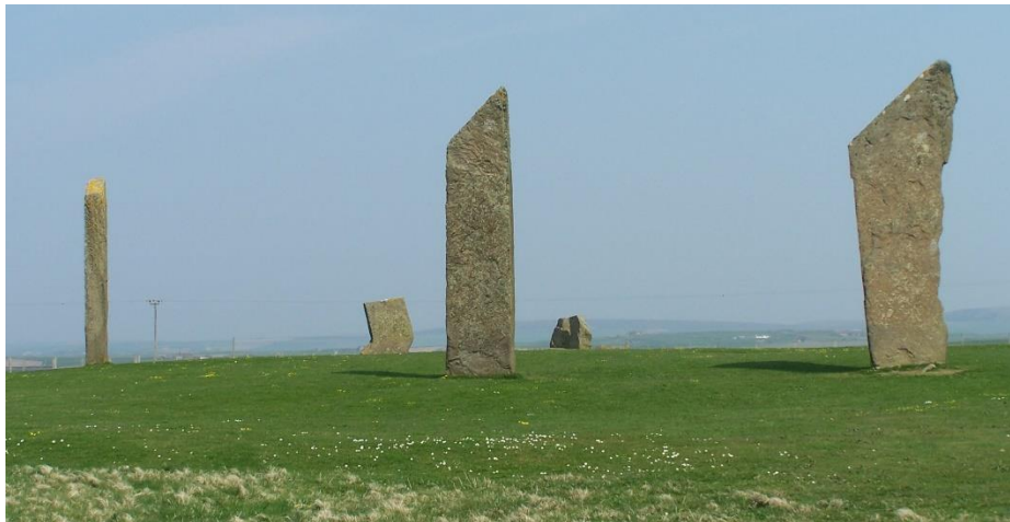
Stones of Stenness, Orkney, Schotland