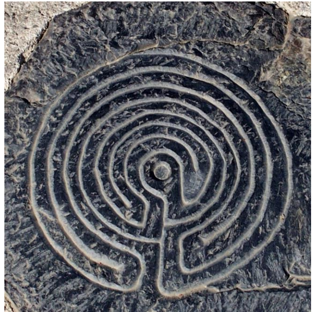
labyrinth op de Waalkade in Nijmegen

De mate waarin en de manier waarop elk van de vier cirkelgeesten in het paganisme tot uitdrukking komen verschilt van traditie tot traditie en tussen verschillende groepen en stromingen. Soms ligt de nadruk meer op de Geest van de Voorouders en minder op de Geest van de Tijd en soms is vooral de Geest van de Plaats van belang. De balans tussen de vier cirkelgeesten en hun samenspel is een levendige dynamiek die telkens weer anders tot uitdrukking komt, en dat is een goed iets want door deze verscheidenheid vormt het paganisme een huis met vele kamers waarin mensen met verschillende achtergronden, behoeftes, voorkeuren en persoonlijkheden hun plek kunnen vinden. En zo moet het zijn!