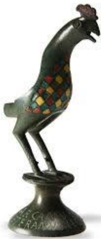
Beeld van een haan uit de tempel van de godin Arcanu onder de kerk van Buchten

Na de val van het Romeinse rijk raakten veel tempels in onbruik of bleven in gebruik als cultusplaats voor de lokale bevolking. Tijdens de kerstening van Nederland in de 7e eeuw werden niet alleen de mensen tot het christendom bekeerd, maar ook veel heidense heilige plaatsen moesten er aan geloven.