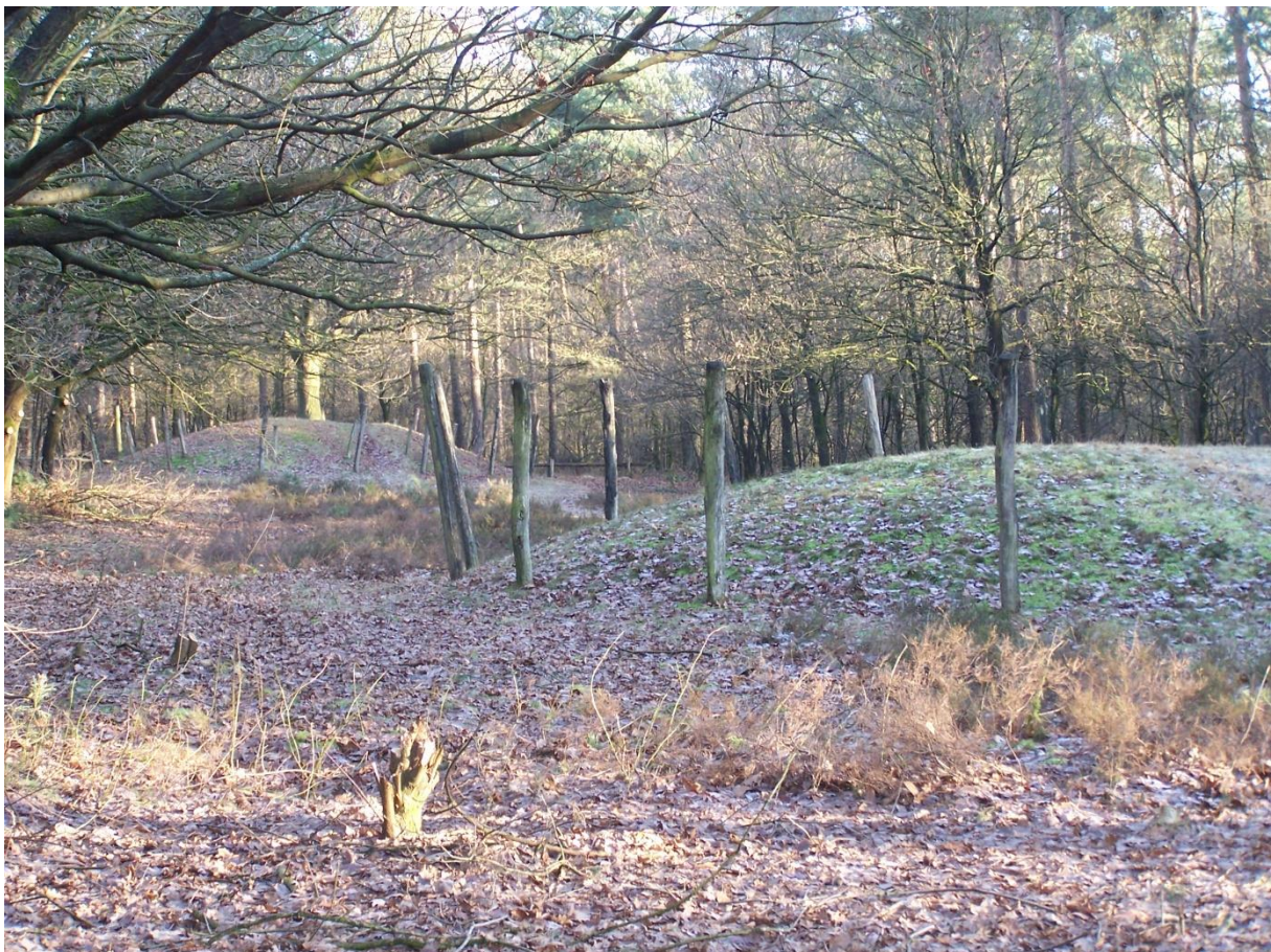
Grafheuvels in Noord Brabant

Dergelijke urnenvelden liggen vaak vlakbij grafheuvels.