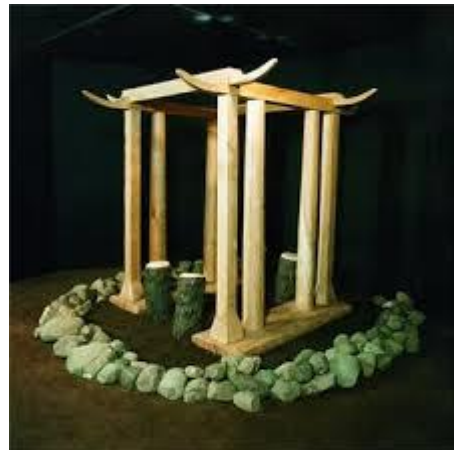
Tempel van Barger-Oosterveld.

In het veen bij het Barger-Oosterveld is zelfs een kleine tempel uit de bronstijd gevonden. Deze tempel bestond uit een cirkel van stenen met een doorsnede van 4 meter. Hierbinnen was met 8 palen een gebouwtje van 2 bij 2 meter neergezet waarvan de hoeken van het dak versierd waren met in hout uitgesneden koeienhoorns. In de tempel heeft vermoedelijk een (offer)tafel gestaan. Deze tempel is rond 1470 vc gebouwd, is gedurende een onbekende periode in gebruik geweest en is daarna doelbewust afgebroken. Een replica van deze unieke vondst is te zien in het Archeon in Alphen aan de Rijn.