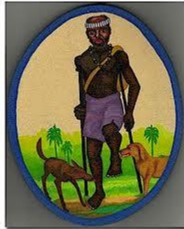
Babalu - Aye

Ook bij de goden van de Yoruba religie heeft het hebben van een handicap een symbolische betekenis, het verwijst vaak naar de ziekte waartegen de desbetreffende god beschermt. Zo loopt de god Babalu-Aye ten gevolge van polio op krukken en wordt hij aangeropen om tegen deze ziekte te beschermen of mensen er van te genezen. Ook andere Yoruba goden hebben zelf de ziekte waartegen ze beschermen. Zo'n duidelijke symbolische functie heeft een handicap of ziekte bij goden van andere pantheons meestal niet.