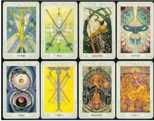
Crowley Thot Tarot

De laatste decennia is er een ware stortvloed aan tarotsets op de markt gekomen. De meeste hiervan zijn sets in een bepaald thema zoals Wicca, Arthurlegenden, Zigeuners, Bomen of Elfen. Vaak zijn ze gebaseerd op de Rider Waite Tarot wat inhoud dat de afbeeldingen op de kaarten en de betekenis ervan sterk op deze set lijken. Andere sets zijn meer op de Crowley Tarot gebaseerd.