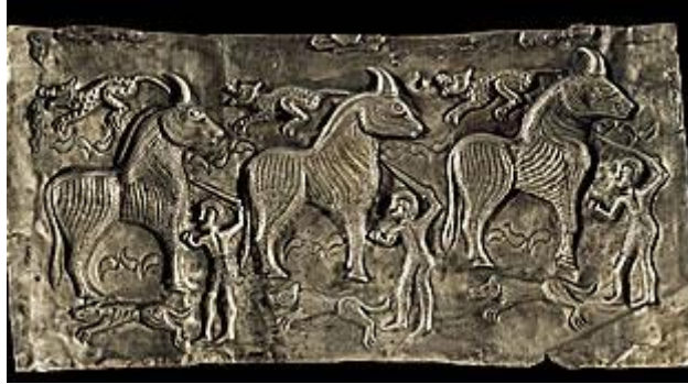
Afbeeldingen van een verdrinkingsoffer en een stierenoffer op de Gundestrupp ketel

Veel van deze offers vonden plaats in heiligdommen en werden uitgevoerd door priesters. Die heiligdommen waren in eerste instantie heilige bossen, meestal natuurlijke bossen maar soms ook aangeplante bossen of zelfs door rechtopstaande boomstammen nagebootste bossen. Uit veel vondsten blijkt dat bomen voor de Kelten een belangrijke spirituele betekenis hadden. Hiernaast kenden de Kelten ook gebouwen die als heiligdom dienst deden.