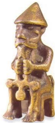
Thor / Donar

Ook de bekende dondergod Thor of Donar is al in de bronstijd terug te vinden. Als hij met zijn bokkewagen over de wolken rijdt veroorzaakt hij de donder en door zijn strijdhamer Mjolnir te gooien de bliksem. Thor is de grote bestrijder van de reuzen die de wereldorde bedreigen. Vanwege zijn enorme kracht en zijn strijdlust was hij erg populair onder krijgers. Zij droegen vaak zijn strijdhamer als amulet om hun hals. Odin en Thor behoren beide tot het Asengeslacht.