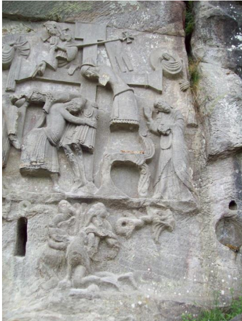
Relief op een Christelijk heiligdom bij de Externsteine dat de overwinning van het Christendom op de heidense religies uitbeeld.