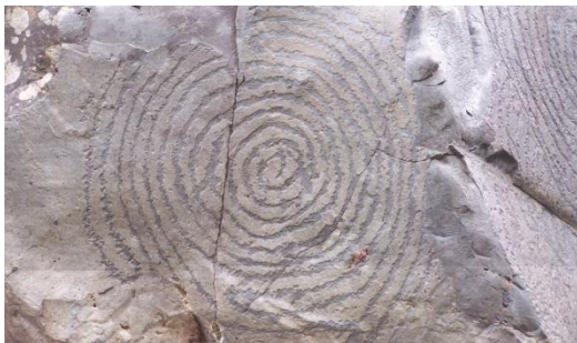
Rotsgravure bij bronheiligdom op La Palma

Het is waarschijnlijk dat de mensen in de nieuwe steentijd geloofden dat er naast onze gewone wereld van mensen, dieren en planten ook nog andere werelden waren, waar spirituele wezens woonden. Er zijn door heel Europa honderden of duizenden offerplaatsen uit deze periode bekend en hierbij valt het op dat deze zich vaak bevonden bij rivieren, meren, moerassen, bronnen, grotten, aan de kust of juist hooggelegen plaatsen zoals bergtoppen. Ook werden er tientallen meters diepe putten gegraven waarin offers werden gedaan.