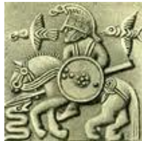
Odin te paard

en dichters. Odin ontdekte de runen, bedreef magie en was constant op zoek naar wijsheid.