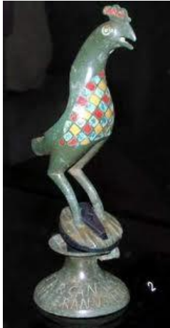
offergave aan Arcanua

zijn de meeste altaren gevonden die gewijd waren aan de Matrones of aan Mercurius, maar ook Jupiter en Mars waren populair in onze streken . De moeilijkheid is echter dat inheemse goden vaak de naam van hun Romeinse tegenhanger kregen. Met Mercurius wordt ook regelmatig de goden Cissonius, Gebrinius of zelfs een vroege vorm van Odin bedoelt.