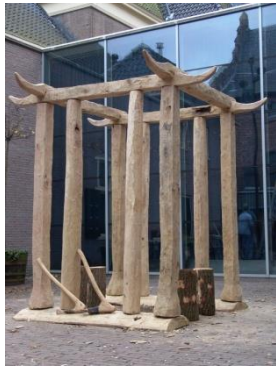
Tempeltje van Barger-Oosterveld (replica)

Het offeren van venen, meertjes en stromend water was een gewoonte die al duizenden jaren bestond maar in de bronstijd in belang toenam. Bijlen van steen en brons waren de belangrijkste offergaven naast allerlei andere voorwerpen zoals geweien, hoorns, wielen, wapens, ketels, sieraden en de kostbaarheden hierboven. Er waren zelfs speciale houten platforms om vanaf te offeren die te bereiken waren met knuppelpaadjes door het veen.