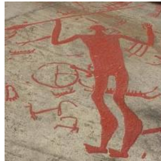
'Odin' als rotstekening

Dat de zon, en wellicht ook de maan, een belangrijke plek hielden in het spirituele gedachtegoed blijkt uit de rotstekeningen in met name Scandinavië waarin wielen met vier of meer spaken veel voorkomen als rotstekening. Deze wielen stellen hoogstwaarschijnlijk de zon voor.