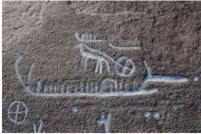
Rotstekening met zonnelymbolen

Bij diezelfde tekeningen vinden we vanaf de ijzertijd mensfiguren die vermoedelijk Goden voorstellen die we kennen uit de latere pantheons van de Germanen en Kelten. Zo zijn er afbeeldingen van een man met een bijl en een man met een speer die voorlopers van Thor en Odin kunnen zijn. Uit de Italiaanse Alpen kennen we een rotstekening die de latere Keltische god Cernunnos voorstelt.