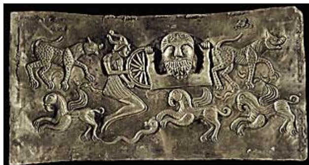
Afbeeldingen van (vermoedelijk) de godin Morrigan en de god Taranis op de Gundestrup ketel.