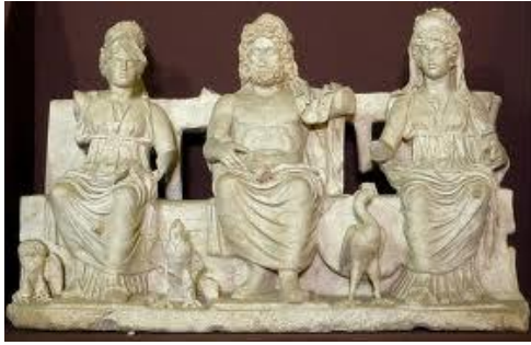
Juno, Jupiter, Minerva

Jupiter is de god van het licht en het vuur, een hemelgod wiens naam stralende betekent. Juno (Jonge Vrouw) heerste over vrouwenzaken en hielp met name bij zwangerschap en bevalling. Verder was ze de beschermgodin van het Romeins grondgebied. Minerva tenslotte was de beschermvrouwe van de ambachtslieden, kunstenaars en artsen.