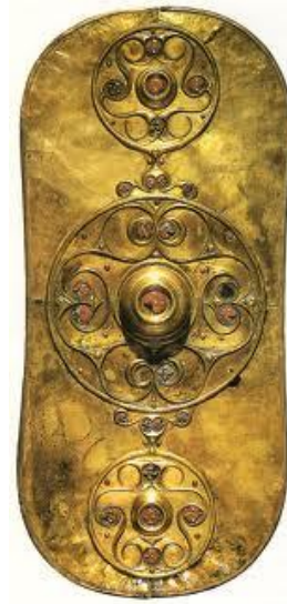
Battersea schild in La Tene stijl

Rond 450 vjt ontstaat er in de Moezelvallei en de Marnevallei een nieuwe stijl die de La Tene cultuur genoemd wordt. Deze stijl gebaseerd op ingewikkelde vlechtpatronen gaat in hoog tempo de Hallstattcultuur overvleugelen. Met de overgang naar de La Tene cultuur komt ook het krijgerselement nog sterker naar voren. Leiders uit de Hallstatt periode werden begraven in vier wielige karren met ceremoniële - en jachtwapens en de La Tene leiders in strijdwagens met oorlogswapens. Als grafgift werd vaak drinkgerei met Grieks en Etruskisch aardewerk meegegeven want de La Tene krijgerselite stond bekend om haar drinkgelagen.