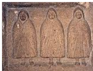
Matrones en 'bemutste geesten'

De Kelten kenden ook aan de zon een religieuze betekenis toe. Ze hadden een zonnegod die in Oostenrijk Belenus heette en op andere plaatsen wellicht andere namen had. Hiernaast is er een 'Keltische Jupiter' geweest die vrij algemeen vereerd werd en misschien dezelfde godheid als Taranis was. Hij werd vaak afgebeeld met een zonnewiel zoals we die al eerder in Scandinavië zagen.