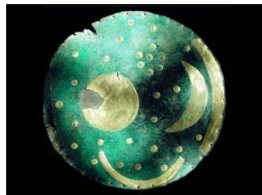
De hemelschijf van Nebra

Op de Mittelberg in Duitsland is een beroemde vondst gedaan: de hemelschijf van Nebra. Op deze bronzen schijf staan de zon, de maan en verschillende punten die sterren kunnen voorstellen. Verder staan er twee gebogen lijnen op waarvan er een, gezien vanaf de vindplaats, de plek van de zonsondergang met zowel midzomer als midwinter aan de horizon aangeeft.