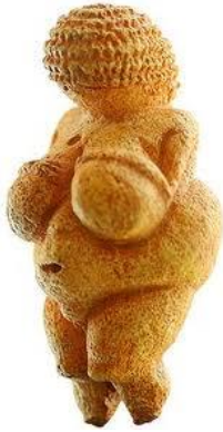
Venus van Willendorf

We weten alleen dat de beeldjes sterk op elkaar lijken en in een uitgestrekt gebied gevonden zijn wat er op wijst dat het religieuze gedachtegoed erbij waarschijnlijk goed uitgewerkt en wijd verbreid was. De cultus rond de venusbeeldjes heeft desondanks vrij kort bestaan, ongeveer 2000 jaar, en is daarna verdwenen.