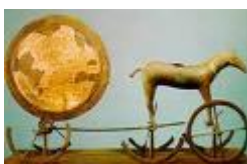
De zonnwagen van Trondheim