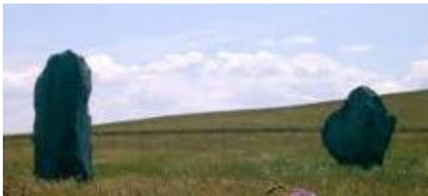
twee stenen van de avenue in Avebury

Ook in de Britse eilanden vinden we aanwijzingen voor het belang van vruchtbaarheid. In Avebury loopt er een weg van een klein monumentje dat sanctuary gedoopt is naar het grote monument bij het dorpje Avebury. Dit monument bestaat uit een henge, een ronde aarden wal met een greppel er omheen met daarin twee steencirkels. De weg van de sanctuary naar de henge is aangegeven door paren stenen. Aan de ene kant staan brede stenen en daar tegenover aan de andere kant smallere stenen. De interpretatie is dat de brede stenen een vrouwelijk symbool zijn en de smalle stenen een mannelijk symbool.