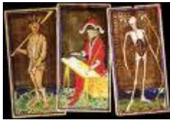
Visconta Sforza Tarot

Wie kaartlegger wil worden heeft vandaag de dag de keuze uit honderden kaartensets. Elk met hun eigen kenmerken, voor- en nadelen. Globaal zou ik deze overvloed aan kaarten willen opdelen in drie soorten die ik nader zal toelichten: Tarot, Waarzegkaarten en Inzichtkaarten