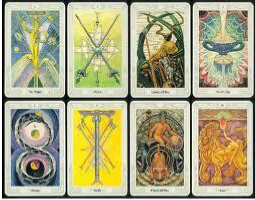
Crowley Thot Tarot

De laatste decennia is er een ware stortvloed aan tarotsets op de markt gekomen. De meeste hiervan zijn sets in een bepaald thema zoals Wicca, Arthurlegenden, Zigeuners, Bomen of Elfen. Vaak zijn ze gebaseerd op de Rider Waite Tarot wat inhoud dat de afbeeldingen op de kaarten en de betekenis ervan sterk op deze set lijken. Andere sets zijn meer op de Crowley Tarot gebaseerd.