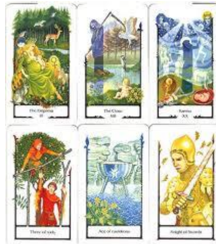
Tarot of the Old Path

Als je weet wat voor soort kaarten je zoekt dan kun je kijken welke set het meest bij je past. Werk je in een bepaalde traditie zoals Wicca, Druidisme of Occultisme dan kun je een set zoeken waarvan de symboliek bij deze traditie aansluit. In de meeste richtingen zijn er verschillende sets te vinden. Kijk dan ook goed of de afbeeldingen je aanspreken want uiteindelijk moet je daar de betekenis van de kaarten uithalen. Het maakt een heel verschil of de afbeeldingen tekeningen of computeranimaties zijn.